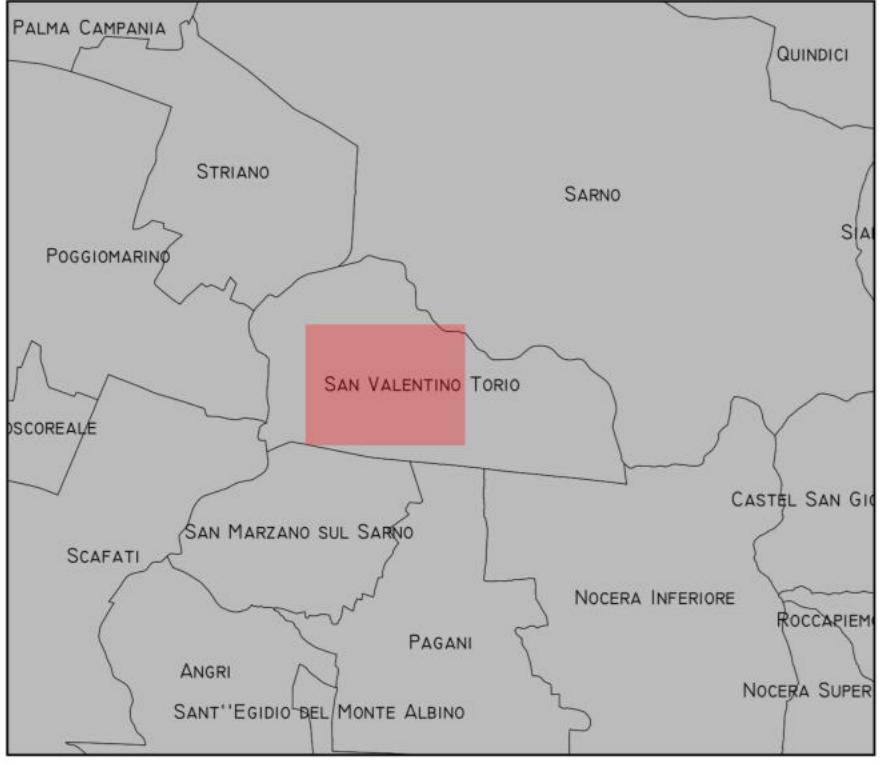
Quadro di Unione - Scala 1:100.000

Base cartografica: Carta Tecnica Regionale Sistema di riferimento: UTM/ETRF2000 Codifica EPSG: 6708